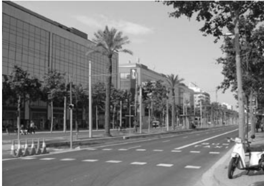
Avenida Diagonal Mar, próxima ao distrito 22@, foto do autor, 27/05/2004.

projetos urbanísticos, que em nome do consenso e da coesão social, e sob a aparência da colaboração público-privada, beneficiam o