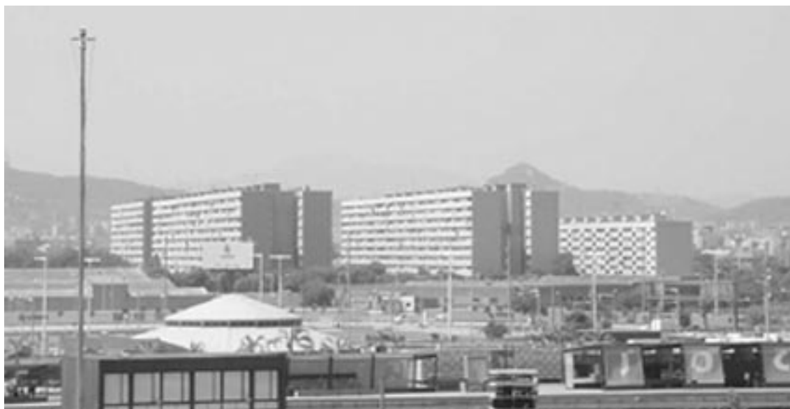
Vista de La Mina a partir do recinto do Fórum, foto do autor, 30/06/2004.

aportes de recursos dessa instituição para o investimento em cidades. Assim, trata-se de um processo que foi influenciado pelas conjunturas e estruturas político-econômico-sociais da Espanha ao longo das décadas de 1970 a 1990, e que não pode ser transposto simplesmente para outras realidades, sem debates e adaptações. Não é um produto que possa ser vendido, como está sendo feito, através da consultoria urbanística.