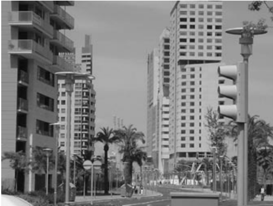
Área próxima ao Fórum, com intenso processo de verticalização, foto do autor, 30/06/2004.

[espécie de bonde sem fios], como um muro, isolando La Mina da nova área de valorização da Diagonal Mar.