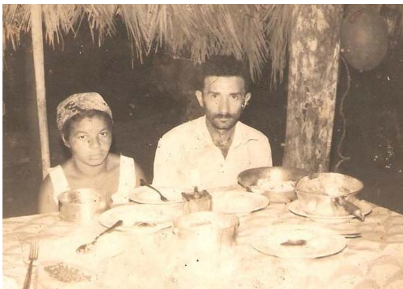
Moradores do povoado.

O núcleo urbano mais próximo de Canabrava do Norte era o povoado de Cedrolândia (atualmente Porto Alegre do Norte), onde havia uma quantidade maior de moradores e já havia ali um campo de aviação, que os próprios moradores organizaram e fizeram com o objetivo de atender casos urgentes, como de doenças.