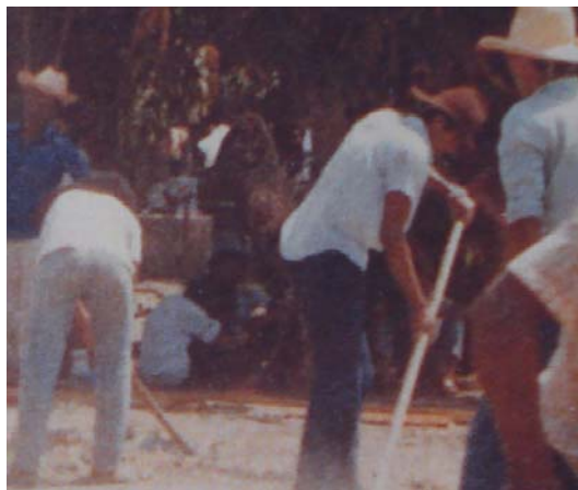
Mutirão para a reconstrução da casa de Cascão.

O bispo da Prelazia, D. Pedro Casaldáliga e outros religiosos procuravam dar assistência aos feridos, buscavam ajuda de autoridades e tentavam manter com o povo uma união, a fim de desmascarar os oportunistas e traidores, que aconteceria firmando a confiança em Deus na sustentação da caminhada.