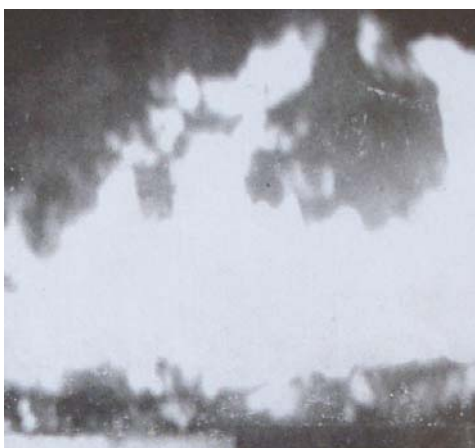
Casa do Cascão em chamas.