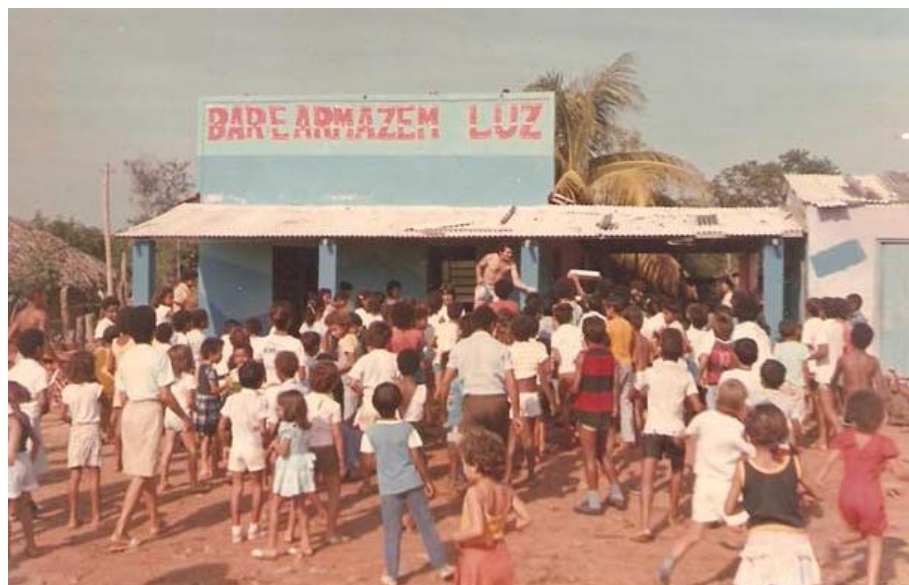
Instalação de comércios mais amplos.

Atualmente o comércio de Canabrava do Norte contribui efetivamente na economia do município. O mesmo conta com um laticínio que embora seja instalado em um local impróprio, é responsável por parte dessa economia, além da produção de soja, milho e girassol.