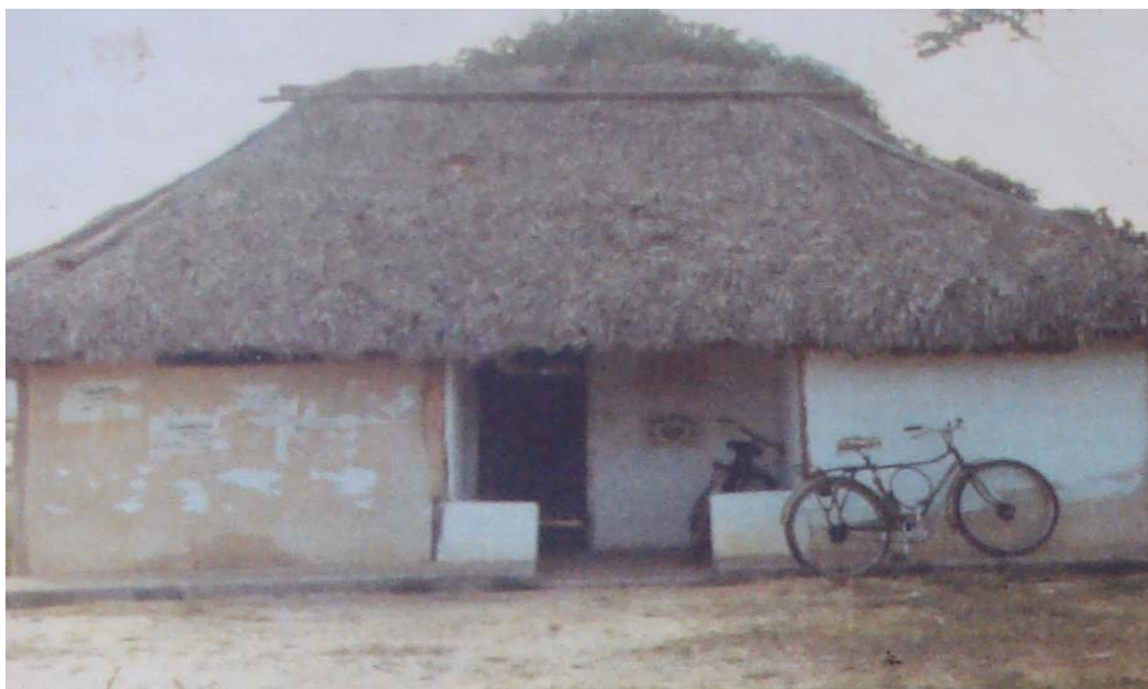
Casa do Prefeito de Porto Alegre do Norte Rodolfo Alexandre Inácio (Cascão).